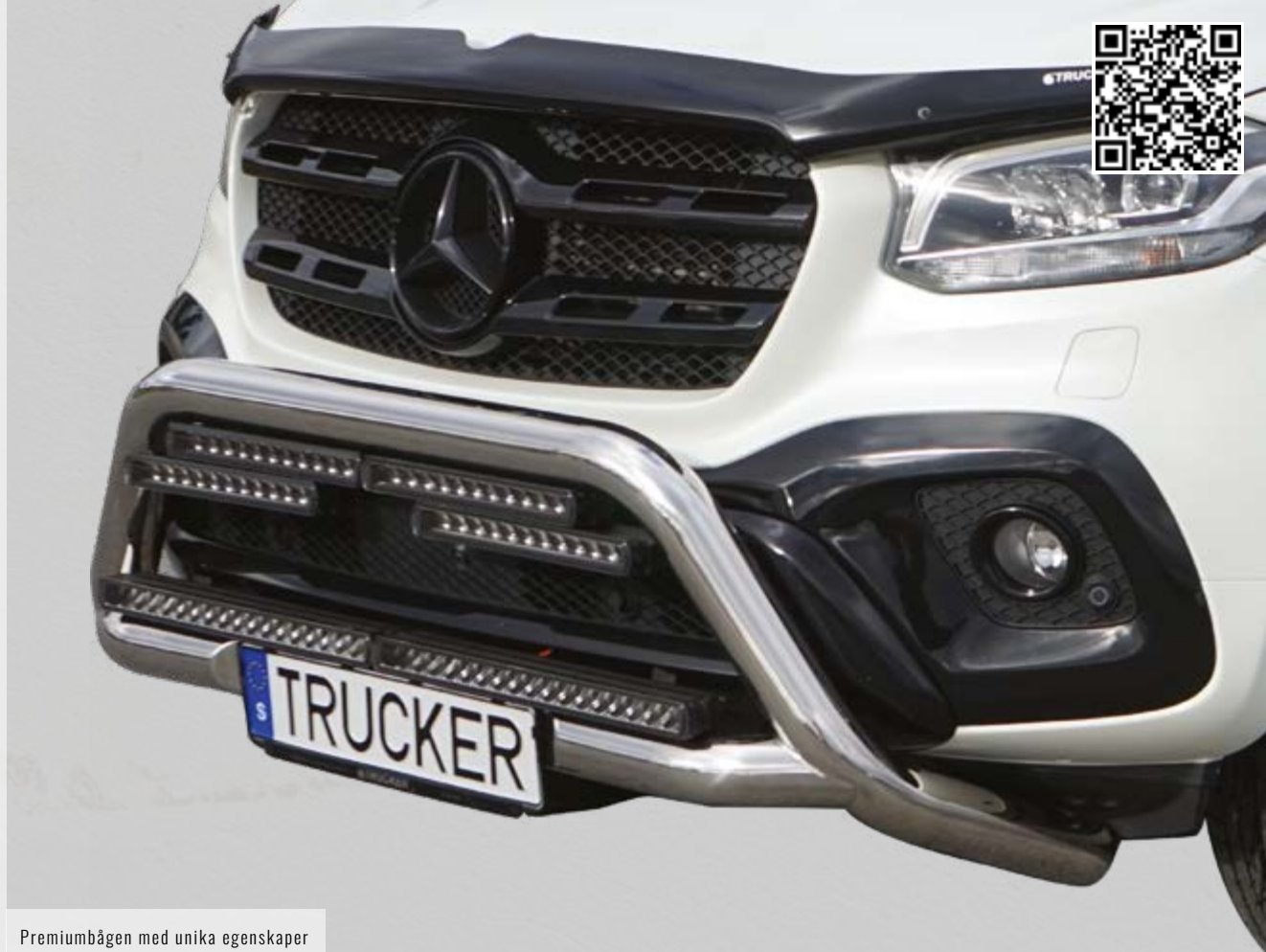
Premiumbågen med unika egenskaper