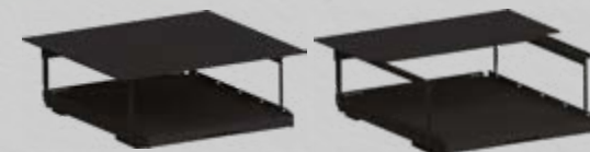
Dubbla lastytan! Smidigt 2-delat övre lastgolv.

OBS! Tillbehören passar bara till Heavy Duty lastsläden