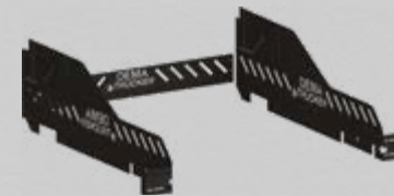
Utnyttja hela flaket! Fasta höga sidor.