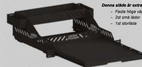
Denna släde är extra utrustad med:

OBS! Tillbehören passar bara till Heavy Duty lastsläden