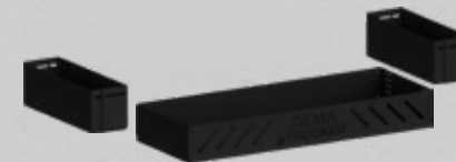
Mer förvaring! Lådor stora som små.